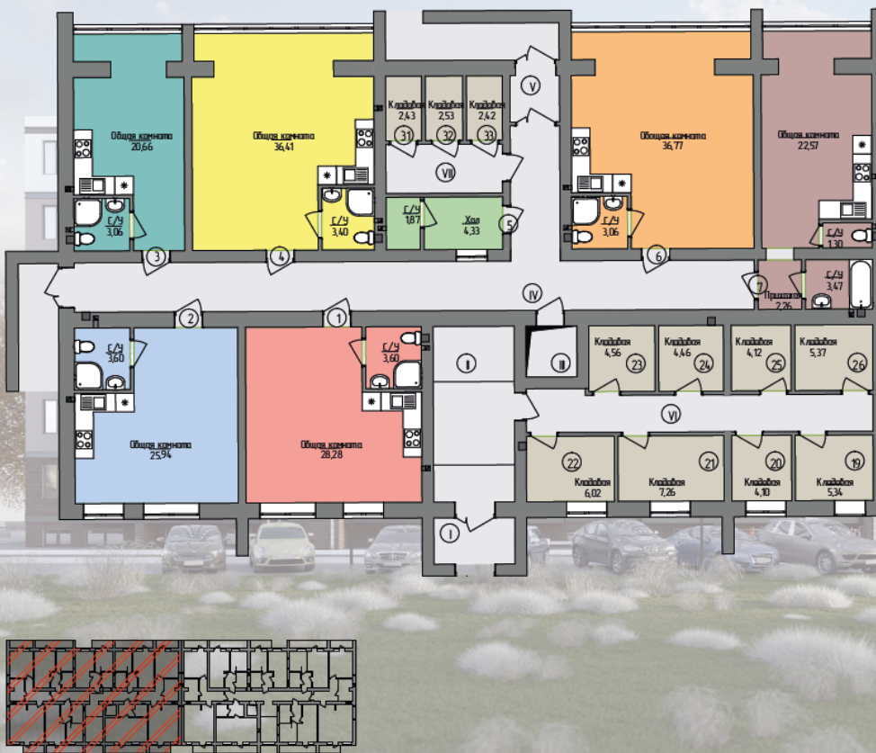
План цокольного этажа секция 1